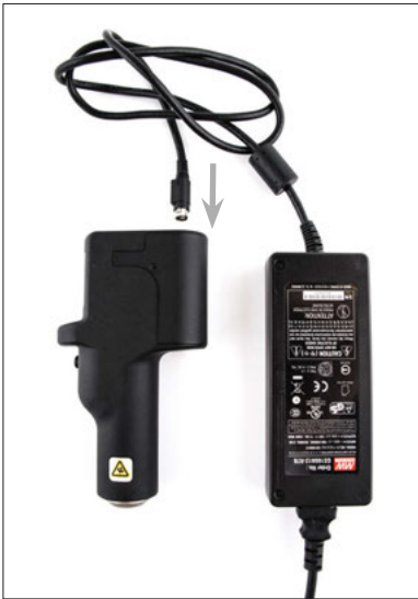
Figure 1. Power supply connector at the top of the HPS crimper